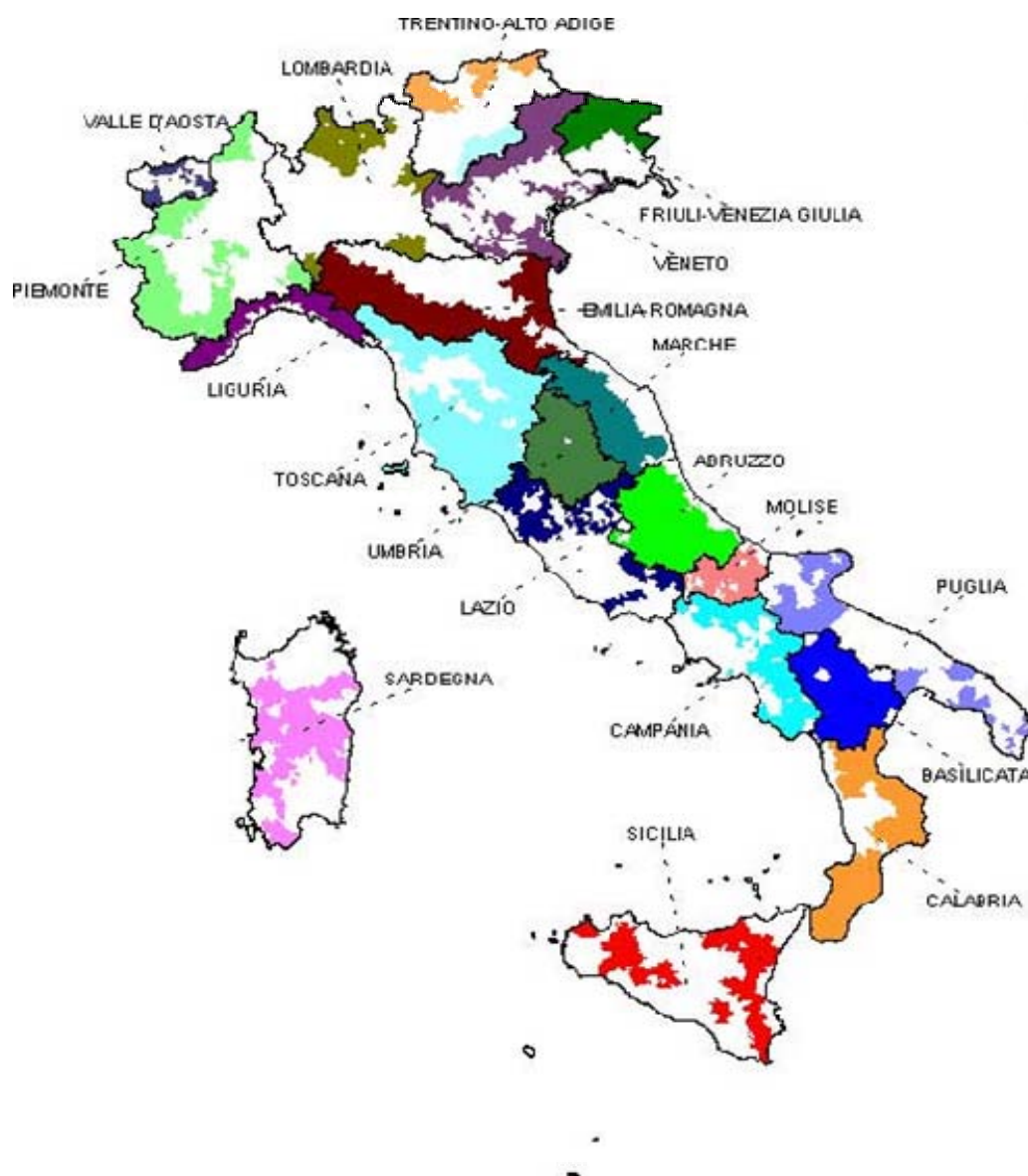
Slika 1: Teritorijalna pokrivenost LAG-ovima po regijama Italije

Izvor: http://ec.europa.eu/agriculture/rur/leaderplus/memberstates/enlarge_it.htm